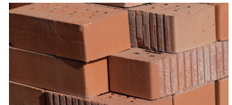
Klinker und Kellerstein