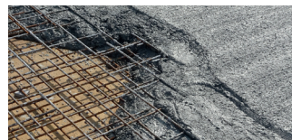
Beton mit Netzarmerung